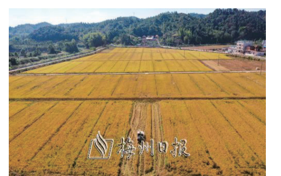
水稻機械化收割,減少了糧食生產過程中的損耗,提升了水稻種植效益。圖爲興寧市大坪鎮潭坑村水稻收割現場。

據了解,截至2020年底,我市主要農作物耕種收綜合機械化率達到53.05%,水稻耕種收綜合機械化率達到72.6%。今年以來,我市農業農村部門通過加強政策引導、資金扶持、試驗示範、提供技術支撐、開展農機社會化服務等,加快推進主要農作物生產全程機械化,預計今年我市水稻耕種收綜合機械化率達74.07%。