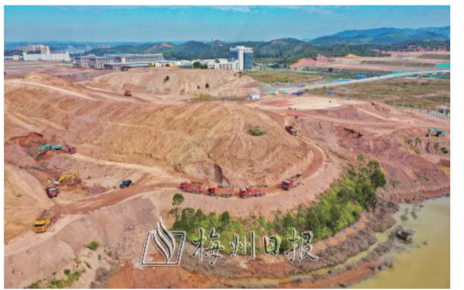
梅州國際無水港項目建設現場。

件,是相關地區編制經濟社會發展規劃、國土空間規劃和專項規劃的重要依據。國家發改委有關負責同志就《規劃》有關情況回答媒體記者提問時表示,“十四五”時期,要以《規劃》爲引領,構建新時代支持特殊類型地區振興發展“1+N”政策體系,即《規劃》作爲“十四五”時期支持全國特殊類型地區振興發展的綱領性文件,主要明確特殊類型地區振興發展的目標定位、重點區域、重點領域和保障措。在此基礎上,進一步區分類型研究制定欠發達地區、革命老區、邊境